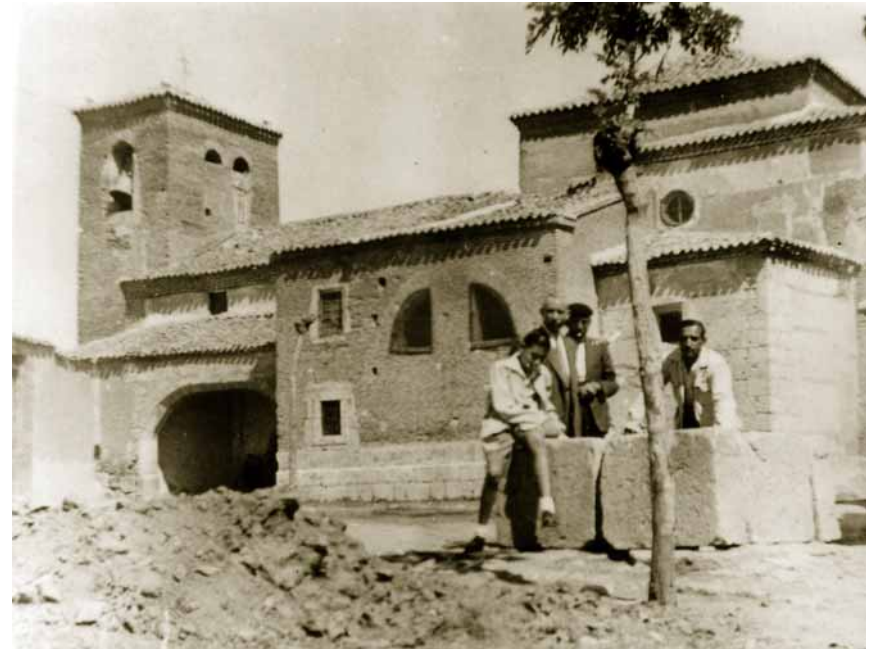
Iglesia de Santiago, de tapial, ladrillo y piedra. Se cree que es el templo más antiguo de Tordesillas.