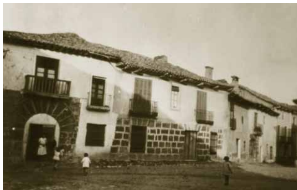
Casas de la plaza de Roma, más conocida como plaza de San Pedro. A la derecha se inicia la calle Eleuterio Fernández Torres.