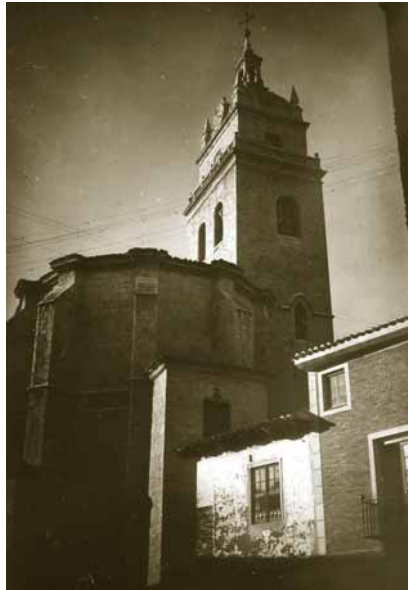
Santa María a comienzos de los cincuenta. La cabecera y los dos primeros cuerpos de la torre son góticos, y el resto de estilo escurialense. La casa que se aprecia en la imagen era de los sastres Tomás y Tomasa.