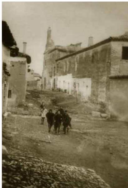
Casa Mantilla y San Francisco en los años cuarenta.