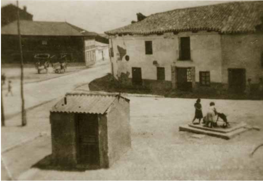
Plaza Pepe Zorita fotografiada en los años treinta. Se trata de una de las plazas más importantes de Tordesillas, conocida ahora como El Foráneo. La caseta era la báscula municipal, la casa de enfrente era la herrería y a la izquierda se ve la fábrica de harinas "La Dolores". En la foto aparecen unas mujeres cogiendo agua en la fuente, que actualmente existe pero que ha cambiado su aspecto.