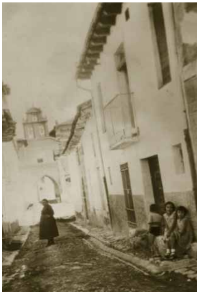
Calle Santa Clara a principios del pasado siglo. En la foto aparecen varios niños y vecinas, con la entrada al Monasterio de Santa Clara al fondo.