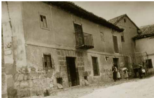
Vivienda corro Santa María, fotografiada en 1926. Esta casa se encuentra frente a la iglesia de Santa María y allí vivieron los padres de Santa Teresa de Jesús y, posteriormente, la familia Cepeda.