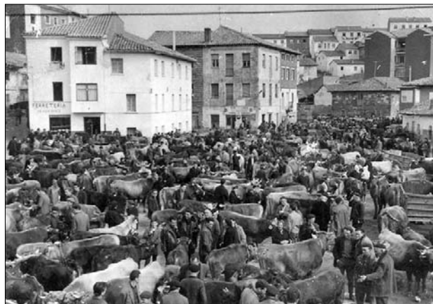
Feria de ganados en la plaza del barrio de La Fuente en los años sesenta.